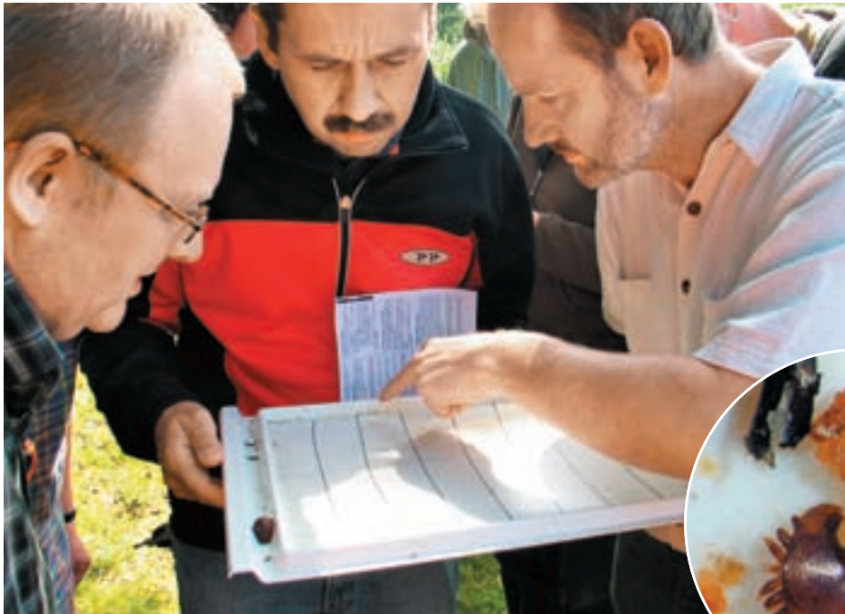
Grafik/Fotos: Pia Aumeier

Je besser man seinen Gegner kennt, desto gezielter kann man ihm begegnen. Das gilt auch für die Varroa. Wer regelmäßig Milben zählt, kann die Situation im Volk einschätzen – und passgenau bekämpfen.